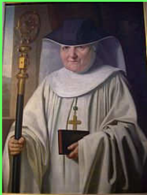
Franziska Aloisia Ochsner 1827–1896

«Nein danke, ich denke selbst! Philosophinnen von der Antike bis heute». Regierungsgebäude, Klosterhof St. Gallen, 15.04.–26.05.2010, Di-So, 14–18 Uhr.