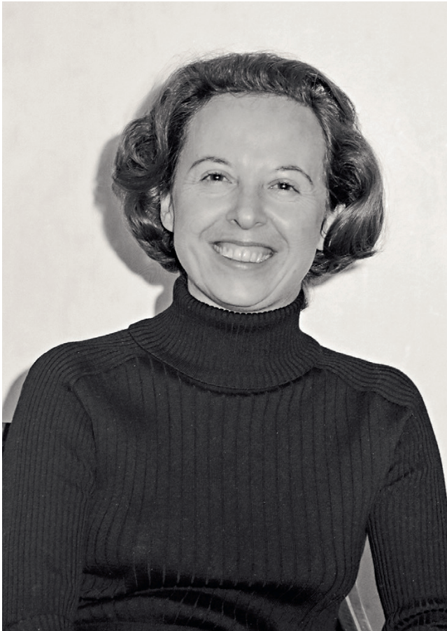
Oben: Margrith Bigler-Eggenberger: Die erste Bundesrichterin der Schweiz ist Anfang September 2022 verstorben. Ihr Nachlass befindet sich im Archiv für Frauen-, Geschlechter- und Sozialgeschichte Ostschweiz.