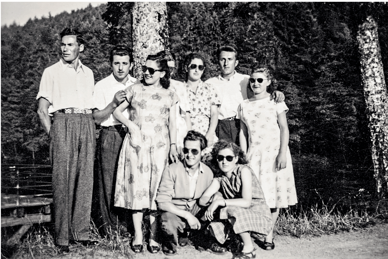
Italienische Immigrantinnen und Immigranten auf einem Sonntagsspaziergang in St. Gallen, Sommer 1951. AFGO.152; Foto Roberto Baraghini.

Das Archiv hat von Beginn an folgende Prioritäten gesetzt: 1. aktives Akquirieren, 2. Geschichtsvermittlung, 3. audiovisuelles Material sammeln und 4. Oral-History-Projekte durchführen. Diese Prioritäten ergaben sich einerseits aus dem ursprünglichen Antrieb für das Frauenarchiv , nämlich Quellen von denjenigen zu sammeln, deren Stimmen in der Überlieferung fehlen. Das macht etwa das aktive Akquirieren zu einer essenziellen Aufgabe – anders als dies