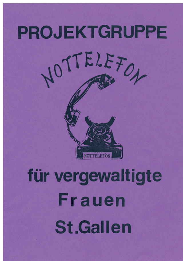
Flugblatt der Projektgruppe «Nottelefon für vergewaltigte Frauen St. Gallen», die 1989 aus der autonomen Frauenbewegung in St. Gallen hervorging. AFGO.028/01; Projekt Nottelefon, ca. 1990.

Sicher nicht schwieriger, als generell Geschichte an junge Menschen zu vermitteln – es geht ja oft darum, ihnen die Relevanz der Geschichte für ihre Lebenswirklichkeit zu vermitteln, um ein Interesse zu wecken. Und das ist bei der Frauengeschichte vielleicht sogar einfacher als bei vielen anderen historischen Themen. Uns fällt auf, dass regelmäßig Schülerinnen bei uns für Projekte oder Maturarbeiten zur Recherche anfragen. Insbesondere die feministischen Streiks von 1991 und 2019 und das Frauenstimmrecht sind für sie interessant. Seit einigen Jahren hat die feministische Bewegung – auch durch die regressiven Tendenzen unserer Zeit – wieder an Stärke gewonnen, global und auch in der Schweiz. Daher wird auch verstärkt nach der Geschichte dieser Bewegung gesucht, denn noch immer fehlt es an Wissen darüber, was in diesem Bereich bereits alles gedacht, getan und geschrieben wurde. Stichwort «mangelnde Erinnerungskultur»: Spannend an dieser Auseinandersetzung von jüngeren Frauen ist, dass es nicht eine rein positive Bezugnahme ist. Heutige queerfeministische und intersektionale Ansätze gehen mit manchen früheren Vertreterinnen der Frauenbewegung auch mal hart ins Gericht und benennen Leerstellen und blinde Flecken. Es ist natürlich generell so, dass jede Generation feministische Themen wieder neu denkt und sich aneignet, weil diese Themen Frauen und genderqueere Personen eben ganz persönlich, oft sogar körperlich betreffen – seien dies Fragen nach